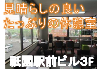
見晴らしの良い たっぷりの休憩室 祇園駅前ビル3F

パソコンは身近にありながら、使いこなすのは大変な労力が必要です。どのようにしたら最短で、技術が磨かれるのか、その答えが、当教室にあります。ぜひ一度、見学にいらっしやってください。経験を積むことによって、大切なあなたの財産になるのです。